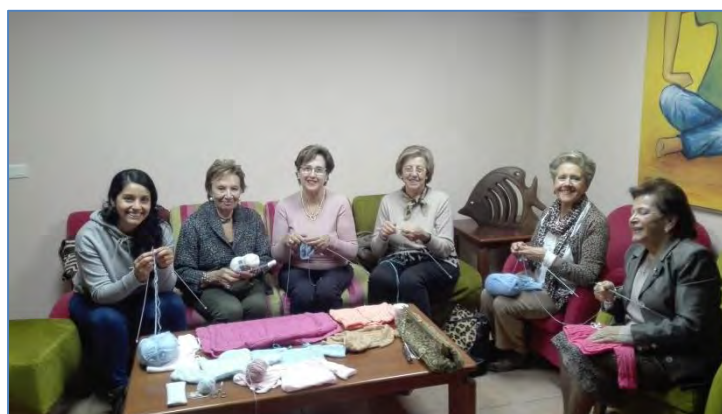
Voluntarias preparación roupa proxecto ANXELA