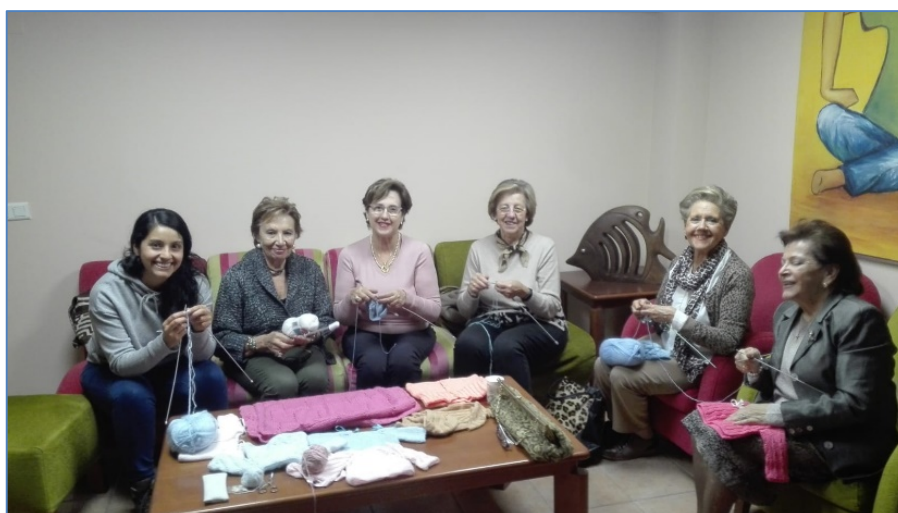
Voluntarias preparación roupa proxecto ANXELA