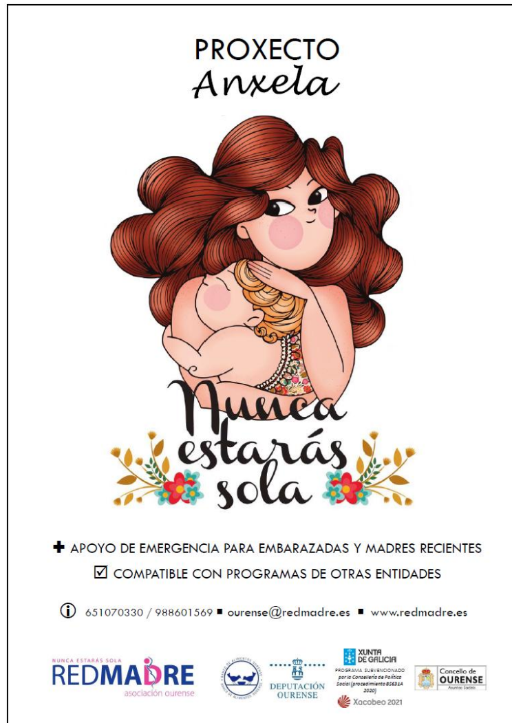
Cartel de difusión del proyecto ANXELA 2020