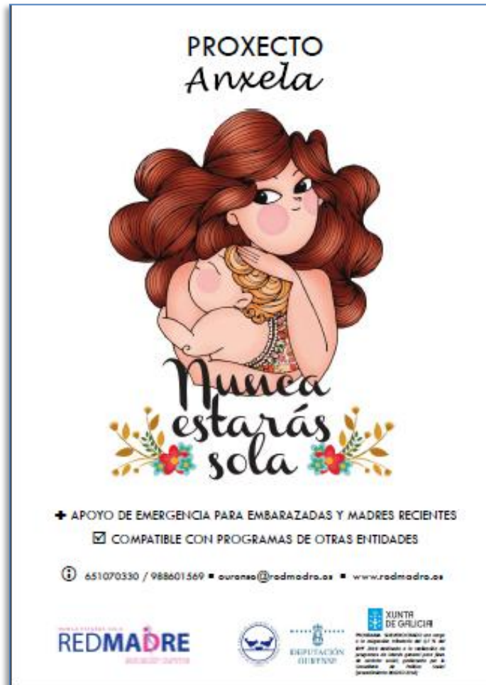
Cartel de difusión del proyecto ANXELA 2019