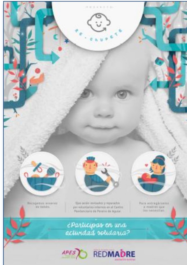
Cartel colocado en las puertas principales y aulas de los colegios