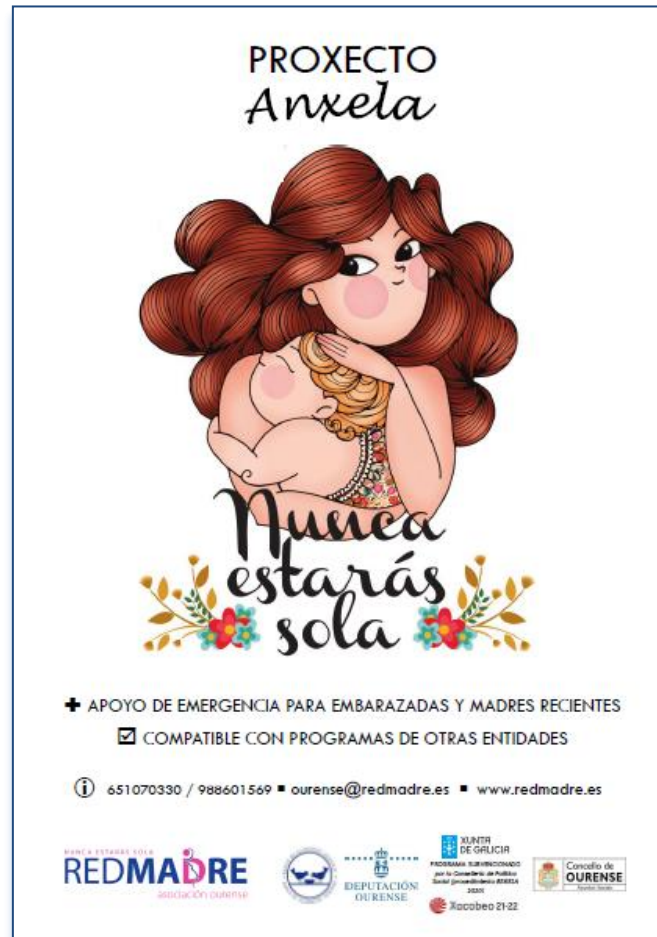
Cartel de difusión del proyecto ANXELA 2022